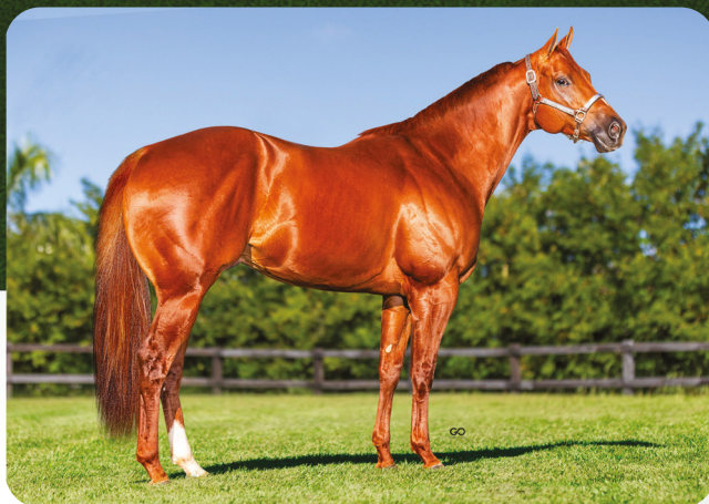
P317870 - 20/08/2020 - MACHO - ALAZÃO