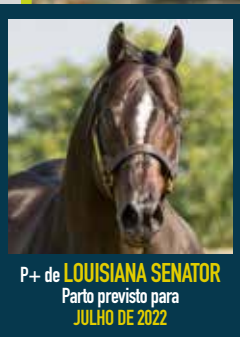
P+ de LOUISIANA SENATOR Parto previsto para JULHO DE 2022