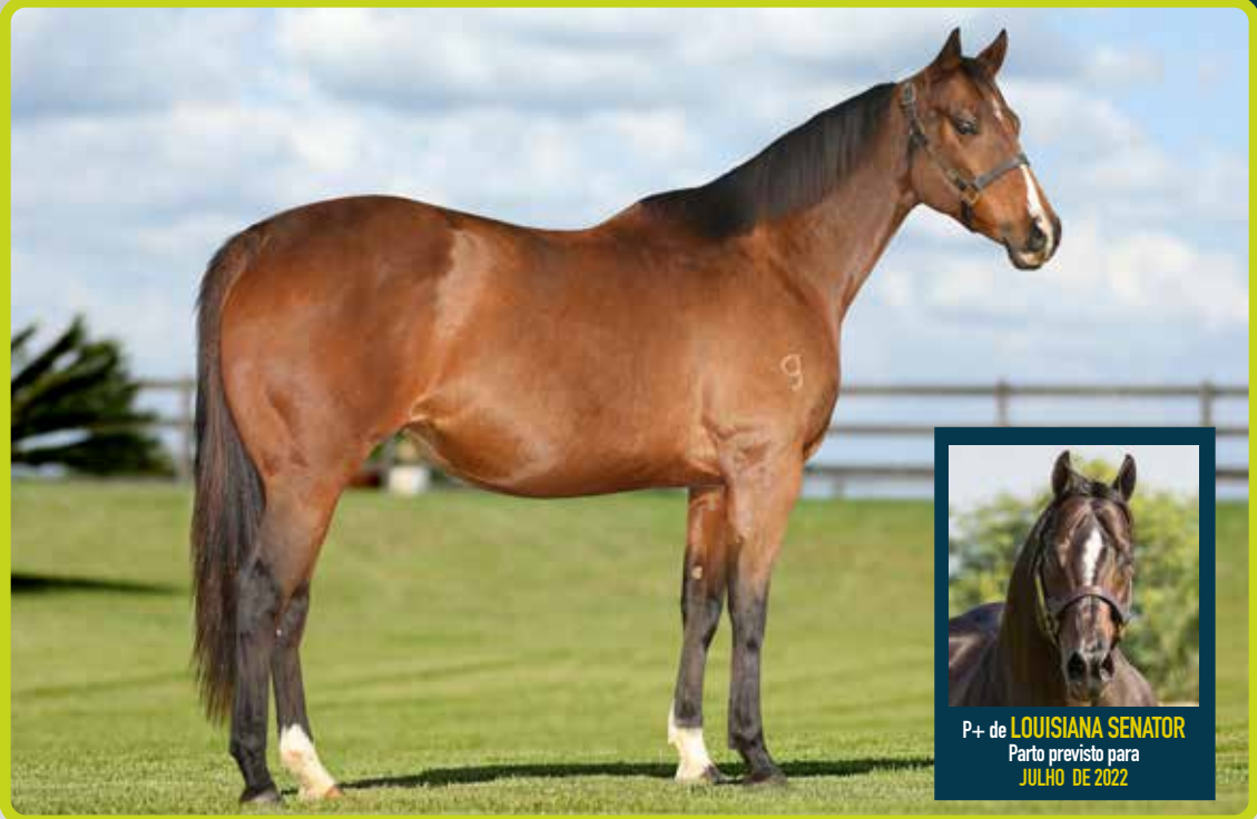
P+ de LOUISIANA SENATOR Parto previsto para JULHO DE 2022